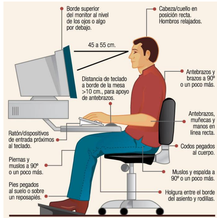
Figura N° 1: Regulaci3n de Plano de trabajo