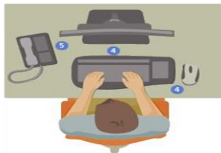
Figura N°2: objetos de trabajo al alcance de las manos