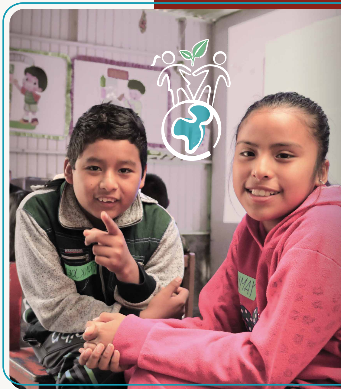
Foto: Niño y niña participando de un taller en el marco del proyecto "Carabayllo reduciendo riesgos", de Save the Children.