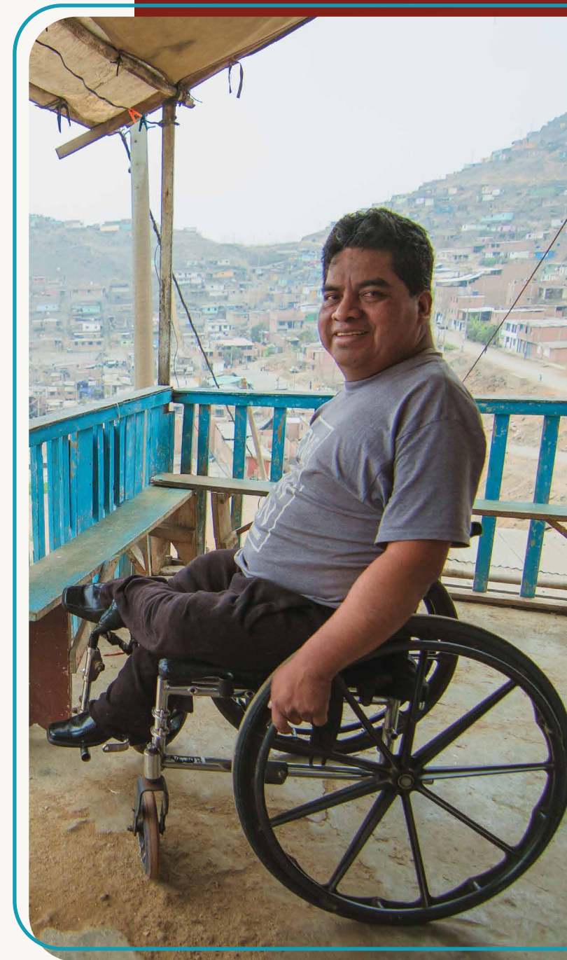
Foto: Vecino con discapacidad en su casa en zona alta en el distrito de Comas.

Desde el 2015, la Oficina de Asistencia para Desastres en el Extranjero de EE. UU. (OFDA/USAID - hoy BHA/USAID) ha financiado intervenciones para la gestión del riesgo en el norte de Lima, a través de Save the Children y del Centro de Estudios y Prevención de Desastres - PREDES. El proyecto actual está comprometido en seguir esta misma línea.