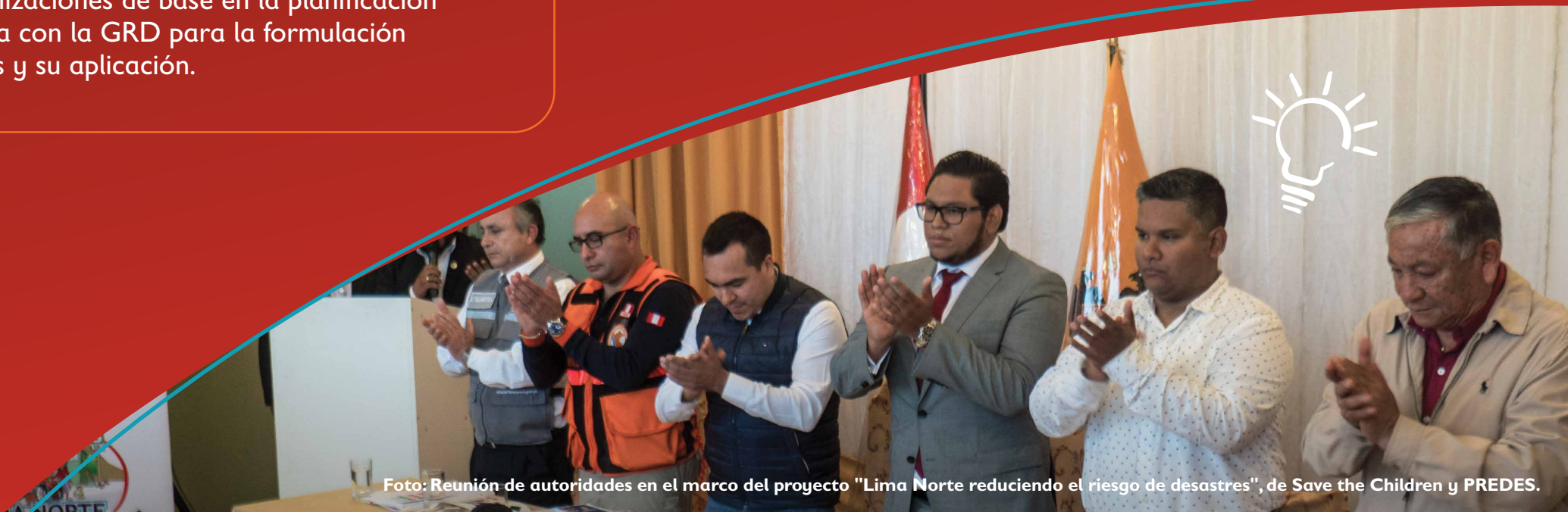
Foto: Reunión de autoridades en el marco del proyecto "Lima Norte reduciendo el riesgo de desastres", de Save the Children y PREDES.